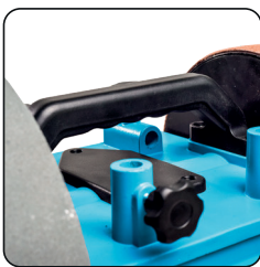
Poignée de transport