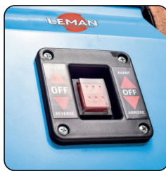
Interrupteur marche/arrêt avec sélection du sens de rotation