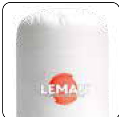
Bolsa de filtración de fieltro