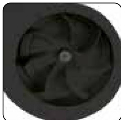
Hélice de acero