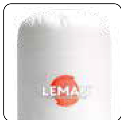
Bolsa de filtración de fieltro