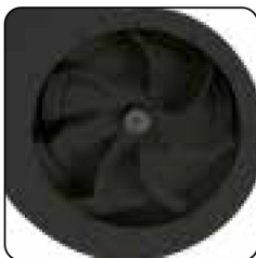
Hélice de acero