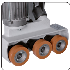
3 Rouleaux ø 80