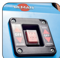
Onderbreker aan / met een selectie voor de draairichting