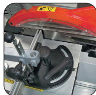
Carrello a filo lama 2000 mm, lama Ø 315 o Ø 250 mm, incisore Ø 100 mm