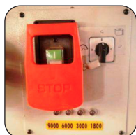
Toupie con 4 velocità di rotazione