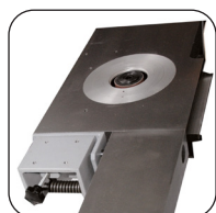
Schaafbank gemonteerd op 2 blokkent