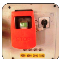
Kettingaandrijving, motoraandrijving met dubbele riem