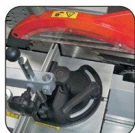
Schaafbank gemonteerd op 2 blokken