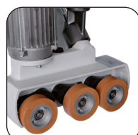
3 rulli Ø 80