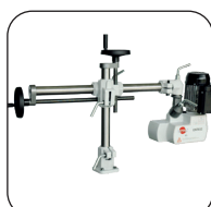
Braccio prolungato di 610 mm