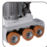
3 rollen van Ø 80