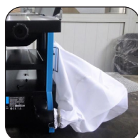
Ingebouwd afzuigstelsysteem (met opvangzak)