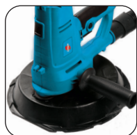
Schuurkop met profiel voor de hoeken