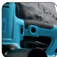
Vergrendelingsknop en toerenregelaar