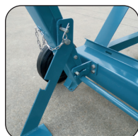
Garra de sujeción