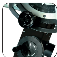
Lama inclinabile a 45° e regolabile in altezza