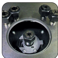
5 pinces de serrage (6 - 6,35 - 8 - 12 - 12,7 mm)