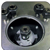
5 spantangen (6 - 6,35 - 8 - 12 - 12,7 mm)