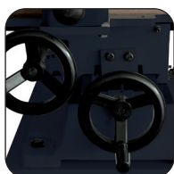
Dubbele draaibank in laterale en lengterichting op zwaluwstaart