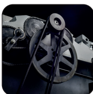
Kettingaandrijving, motoraandrijving met dubbele riem