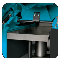
Schaafbank gemonteerd op 2 blokken