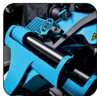
Tête avec coulissement radial