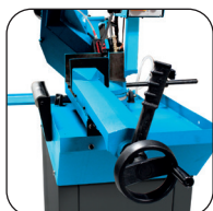
Étau à serrage rapide avec levier à rattrapage de jeu