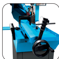
Snel aan te spannen spantang met hendel voor spelingscompensatie