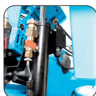
Afdaling van de boeg door hydraulische cilinder met regelbaar debiet