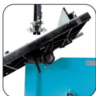
Tafel, kan tot 45^\circ hellen