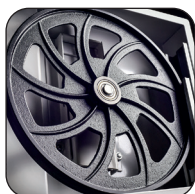
Uitgebalanceerde vliegwiel in gietstaal