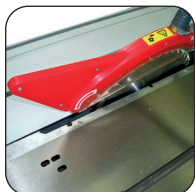
Zaagbladslede van 2000 mm