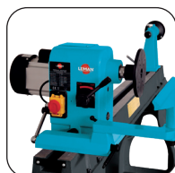
Rotatie van de kop jusqu'à 180°