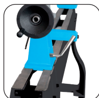
Vaste en mobiele meetbek geboord op 10 mm