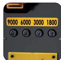
4 velocità di rotazione