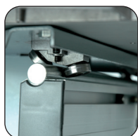
Carrello per tenoni con scorrimento su cuscinetti a sfera