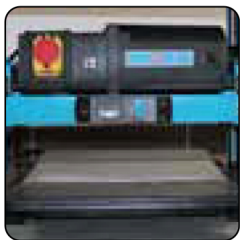
Mesa de cepillado de acero galvanizado.