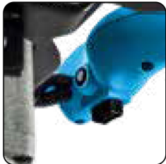
2 modos de velocidad lenta/rápida