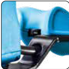
Regulador de velocidad electrónico