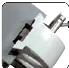
Deslizamiento del cabezal en cola de milano