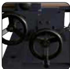
Doble carro lateral y longitudinal en cola de milano