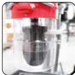
Protector del portabrocas oscilante y ajustable