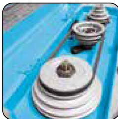
Poleas de acero