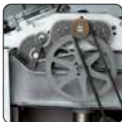
Accionamiento mediante cadena. Accionamiento del motor con doble correa