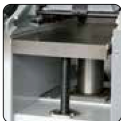
Mesa de cepillado montada sobre 2 toneles