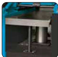
Planing table mounted on 2 shafts