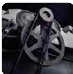
Chain drive Double-belt motor drive