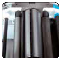
Driving rollers for log feed 95 mm shaft with 4 blades