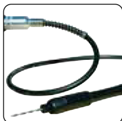
Tubo flexible con mandril Ø 3 mm para microherramientas