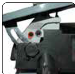
Mesa de aluminio fundido con inclinación de 45°