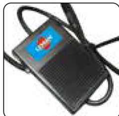
Control de marcha/parada mediante pedal