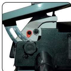
Table en fonte d'aluminium inclinable à 45°