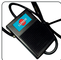
Commande de marche/arrêt par pédale