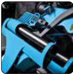
Cabezal con deslizamiento radial