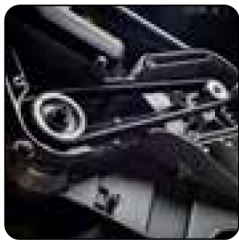
Transmisión mediante correa