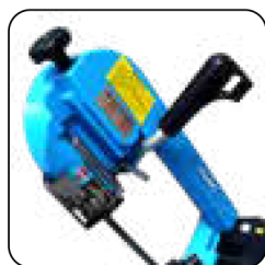
Palanca de ajuste de la tensión de la hoja