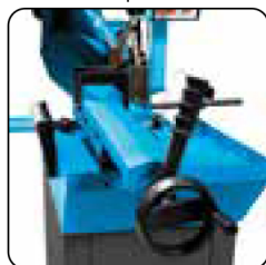
Mordaza de apriete rápido con palanca de ajuste del juego