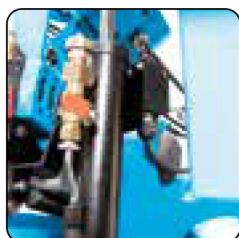
Descenso del arco mediante Cilindro hidráulico con regulación de la velocidad de bajada del cabezal