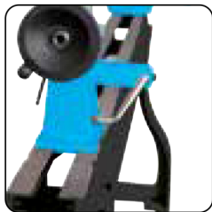
Cabezal fijo y móvil taladrado a 10 mm