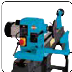
Rotación del cabezal hasta 180°